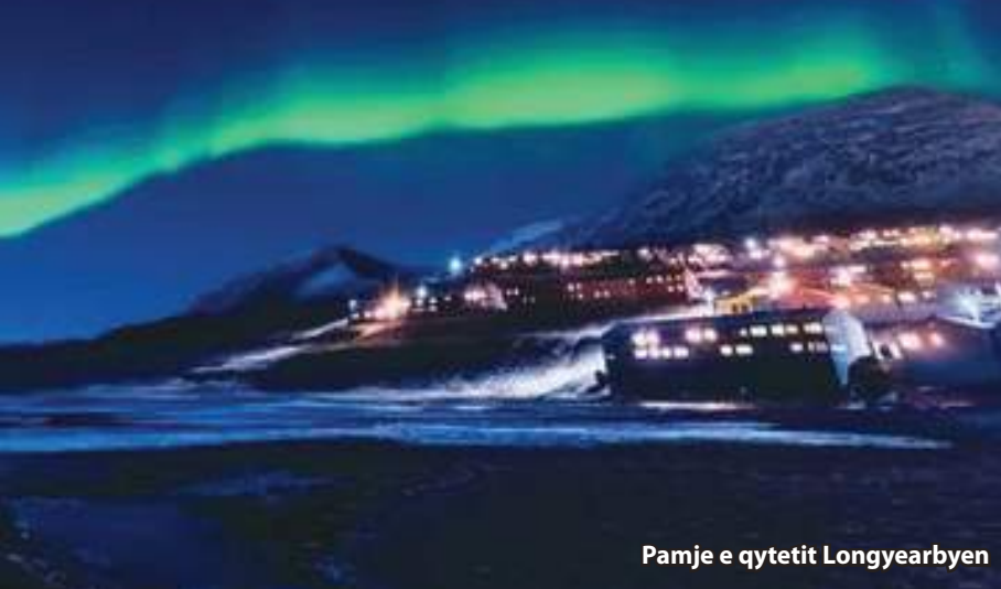
Pamje e qytetit Longyearbyen