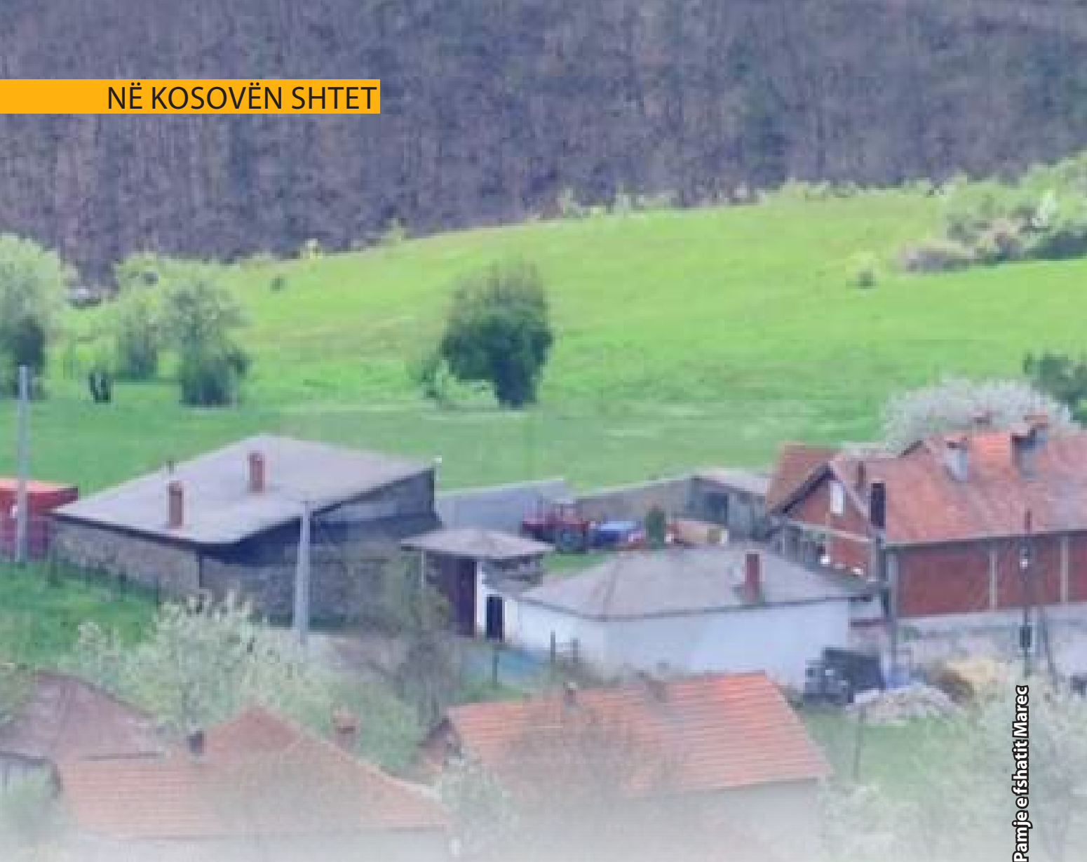
Pamje e fshatit Marec