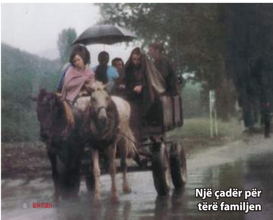
Një çadër për tërë familjen

Andaj, me jetën, durimin dhe sakrificën e tij, sikur tha: "Nuk vdiset nga plumbat e armikut!".