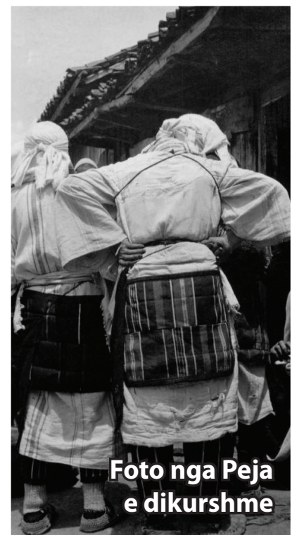
Foto nga Peja e dikurshme