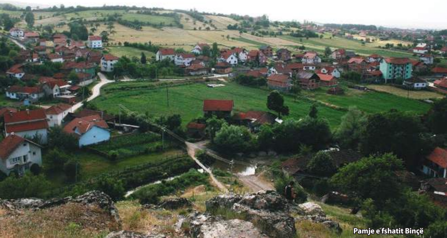
Pamje e fshatit Binçë