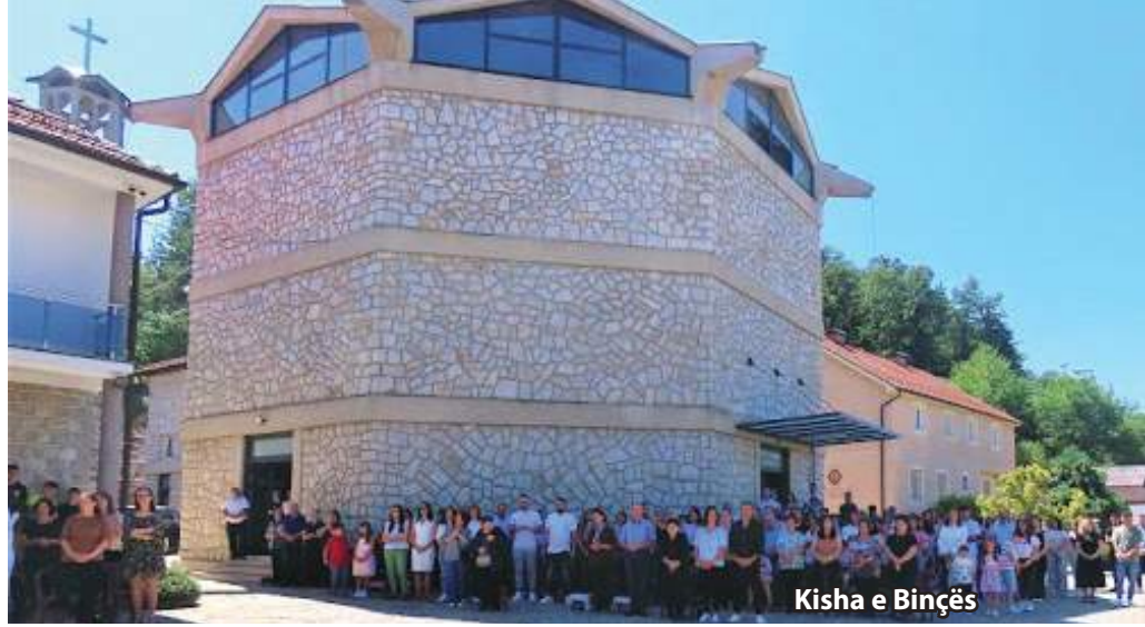
Kisha e Binçës