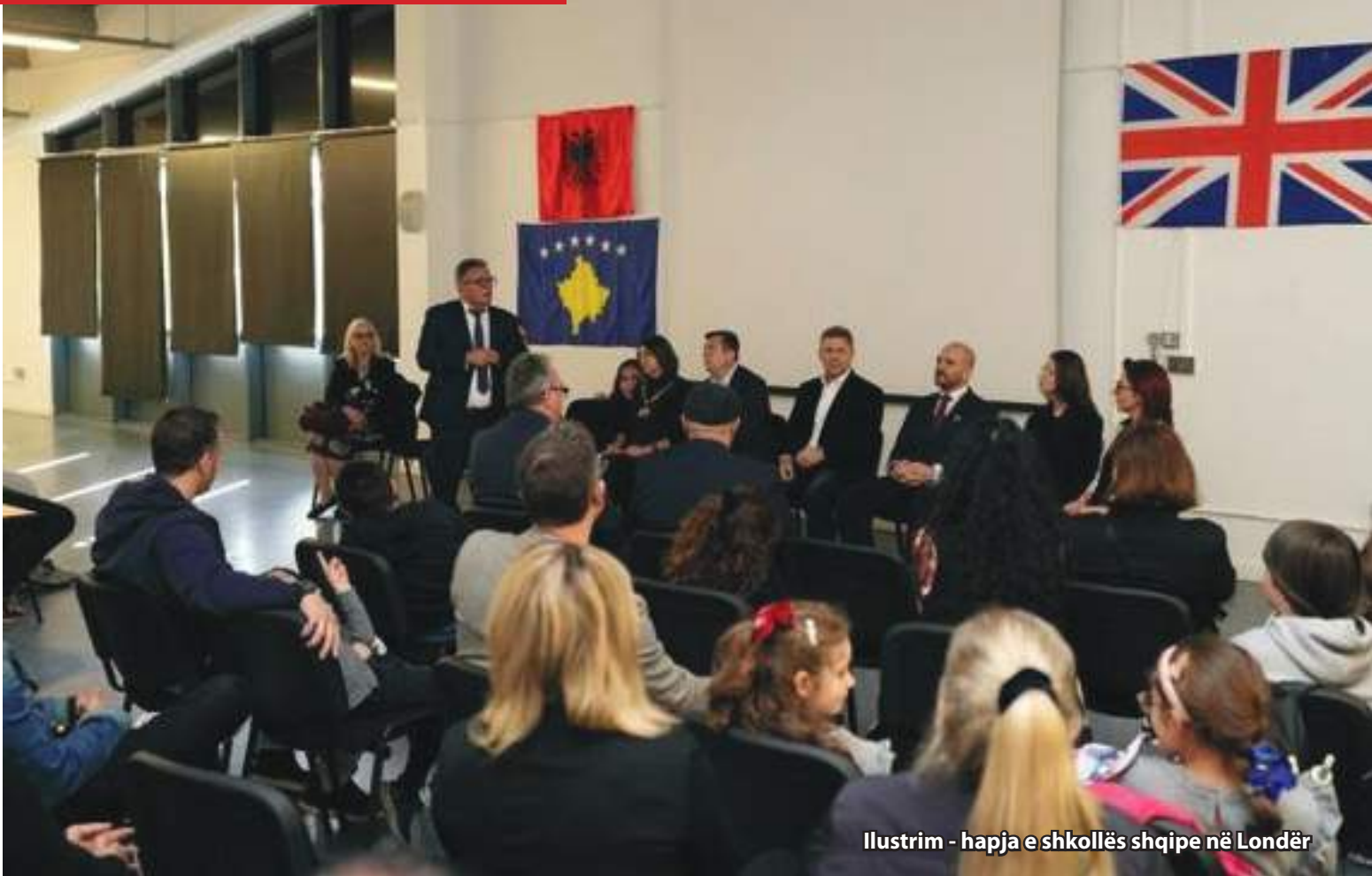
Ilustrim - hapja e shkollës shqipe në Londër