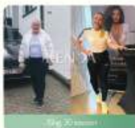
79kg 30 sesioni