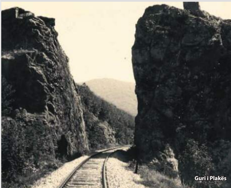
Guri i Plakës