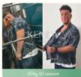
89kg 20 sesioni