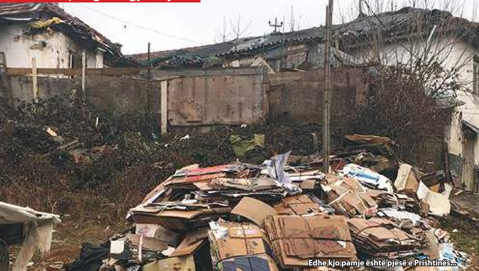
Edhe kjo pamje është pjesë e Prishtinës...