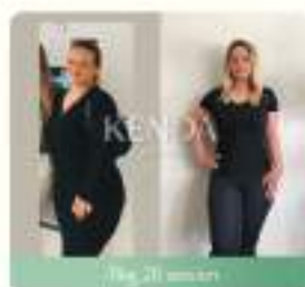
119kg 20 sesioni