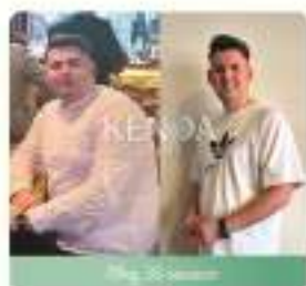
39kg 36 sesioni